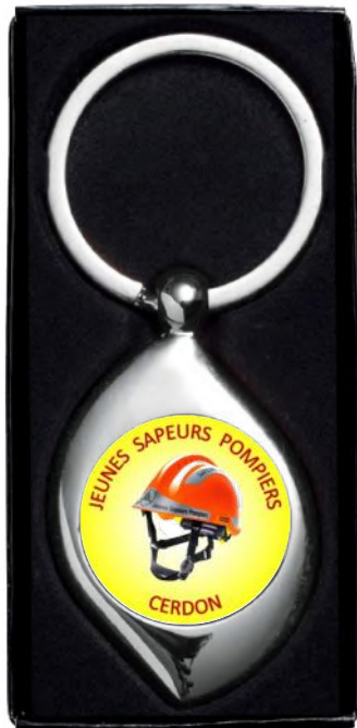
Dimensions Porte-Clés 31 x 82 mm