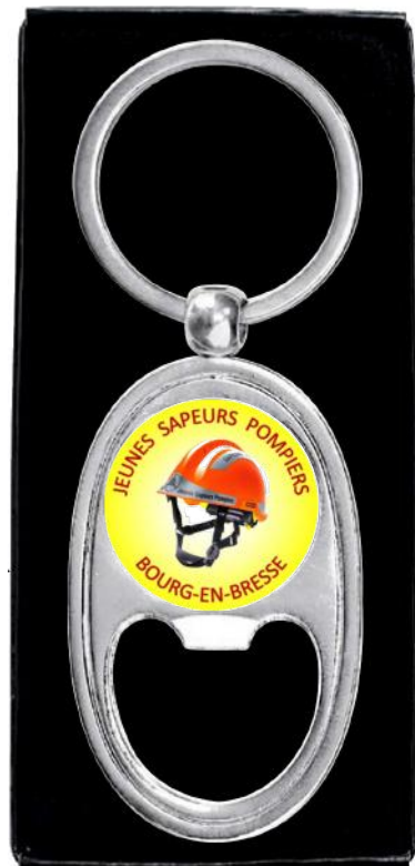
Dimensions Porte-Clés 36 x 93 mm