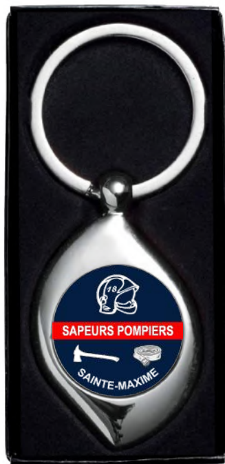
Ref. M 961 SAP